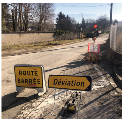
Selon l'avancée des travaux, la rue des Amours sera interdite, sauf pour les riverains.