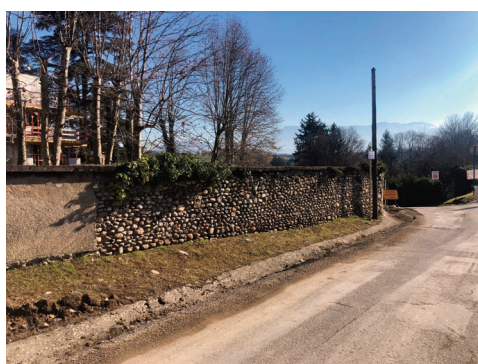
Le vieux mur sera bientôt détruit.

Dans ce cadre et pour sécuriser les déplacements des habitants du quartier, dont ceux des résidences Gabriel et Raphaël (en cours de construction), situées rue des Amours, la Ville de Rives et les promoteurs immobiliers COGECO et SDH ont formalisé un partenariat afin d'aménager le secteur.