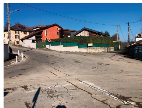
Le carrefour va être sécurisé.

Des travaux de raccordement aux réseaux d'eau pluviale et d'assainissement ont d'ores et déjà été entrepris, pour laisser ensuite la place au chantier de démolition du mur actuel faisant office de séparation de la parcelle avec la voirie.