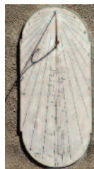
5 Cadran solaire