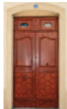
3 Ancienne maison communale