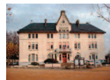
6 Hôtel de ville