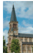
2 Eglise Saint-Valère