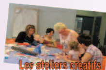
Les ateliers créatifs