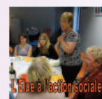
L'Elue à l'action sociale