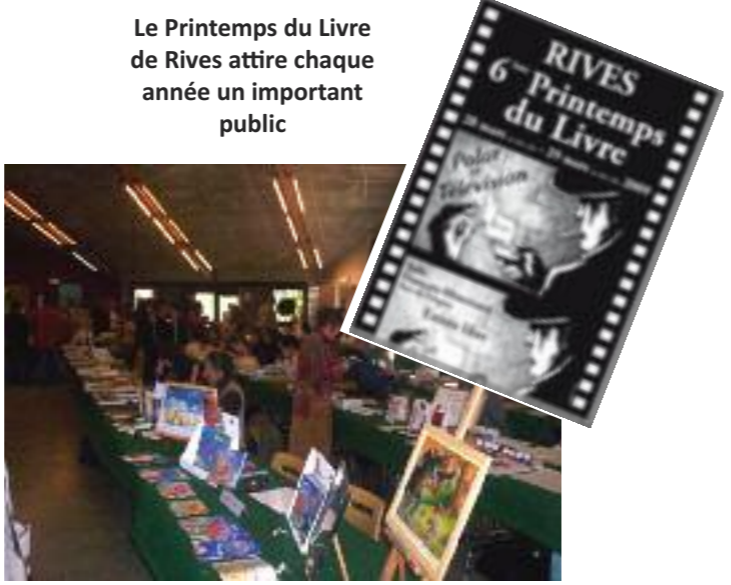
Le Printemps du Livre de Rives attire chaque année un important public

La commission Culture et Animation organise un grand concours de poésie sur le thème de l'eau en collaboration avec le Printemps du livre. Ce concours s'adresse à 2 publics : les primaires (CM1 et CM2), et les collégiens (6 ème , 5 ème ). Le règlement du concours sera disponible à partir de début janvier 2010 et les poèmes sont à rendre avant fin février en mairie. La remise des prix aura lieu lors du salon du livre le 28 Mars 2010 par le jury CME. Tous les poèmes seront mis en valeur et exposés pendant le Printemps.