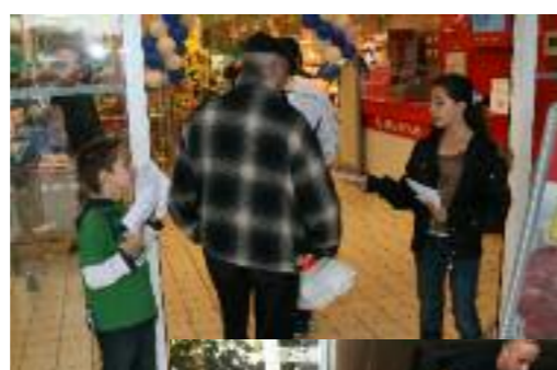
Distribution de tracts à l'entrée de Carrefour Market