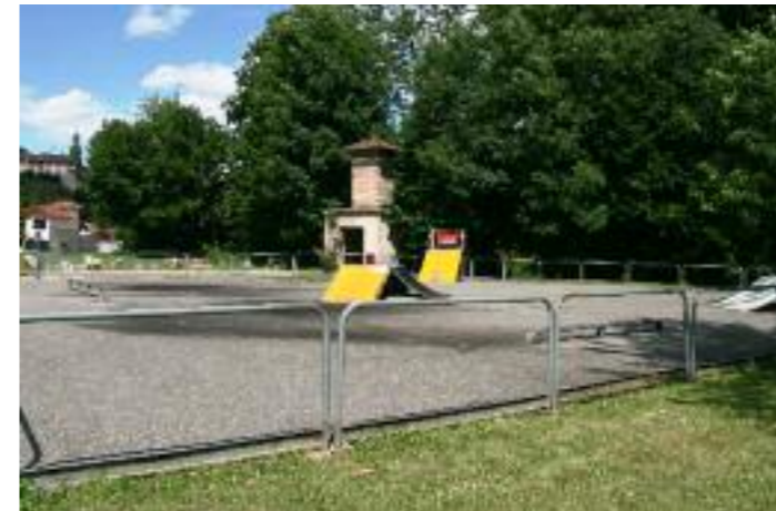
Le skatepark à l'origine...

Construit en 1997, à l'initiative des premiers élus du CME à Rives, le skatepark de la rue de la Liambre a été, au fil du temps, totalement dégradé ! Nos copains de la commission Sport et Aménagements de la ville, ont ainsi remarqué que cet espace dédié aux skates et aux rollers, a même été dépouillé de ses modules ! Il ne reste plus qu'une rampe et deux barres au sol !