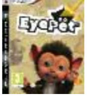
Le jeu vidéo Eyepet

Bonjour, c'est la chronique d'Hugo ! Vos parents ne veulent pas de chats, de chiens, de mygales ou de pythons, achetez un Eyepet. Qu'est-ce qu'un Eyepet : c'est une créature virtuelle et interactive. Le jeu est composé d'une carte "magique" et bien sûr du CD. Dans ce jeu amusant vous devez vous occuper d'une espèce de petit singe, que vous pouvez relooker, nourrir, doucher et faire des petits jeux appelés défis. Grâce à l'interactivité, vous apparaissez à l'écran et agissez avec l'Eyepet comme un animal réel. La carte "magique" se transforme en un objet selon les défis. Bien sûr il n'appartient qu'à une personne, mais vous pouvez jouer à plusieurs pour faciliter les défis. Voilà, donc si vous avez une "Playstation 3", un conseil...adoptez-le !!