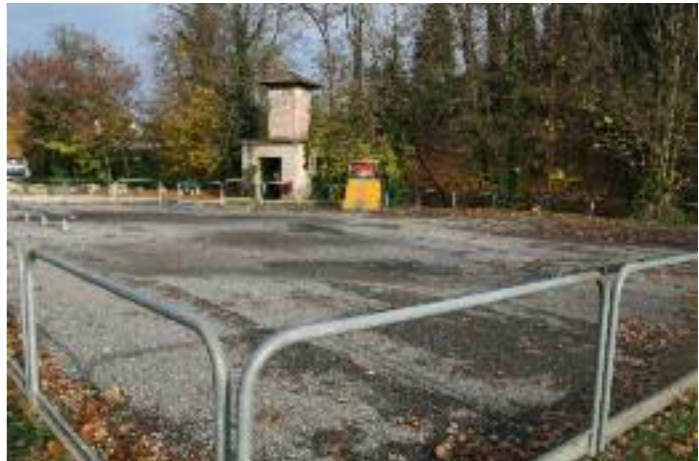
Ce qu'il en reste aujourd'hui !

Nous, les élus du CME, nous n'arrivons pas à comprendre qu'on puisse ainsi saccager un lieu comme celui-ci. Les services de la mairie vont associer nos copains du Sport et des aménagements de la ville, à la reconstruction du skatepark (avec des modules en béton cette-fois). Et pour bien marquer leur ras-le-bol, ils ont décidé d'organiser un nettoyage citoyen des abords du skatepark, dès le retour des beaux jours ! Nous vous précisons en temps utiles la date de cette opération et nous comptons aussi sur tous ceux que cela révolte pour participer.