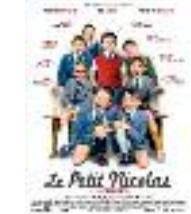
Le film "Le Petit Nicolas"

C'est un très bon film ! Les gags sont drôles et pas une minute ne se passe sans entendre un éclat de rire dans la salle ! Si vous avez lu les livres du « Petit Nicolas », vous reconnaîtrez certainement quelques épisodes. Un film pour petits et grands et tous les fans du Petit Nicolas.