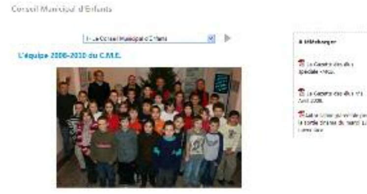
Une vue de la page d'accueil du site et de la rubrique spéciale CME